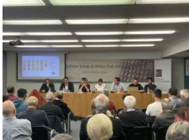
ΙΝΠ – Παρουσίαση εναλλακτικής έκθεση για την οικονομία του ΙΝΠ (5/2023)