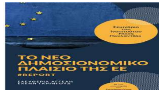
Σεμινάριο ΙΝΠ/Euromemo (6/2023)