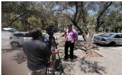
Συνέντευξη στο ZDF (7/2023)