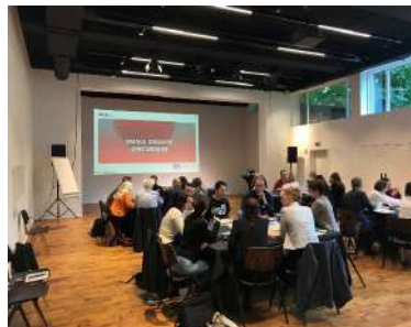
Future Lab – Wise Project (Βρυξέλλες, 9/2023)